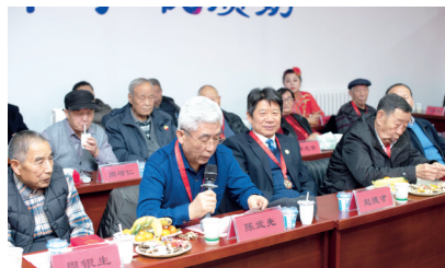
北京知识青年代表座谈发言