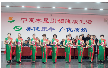
旗袍秀《幸福中国万万年》