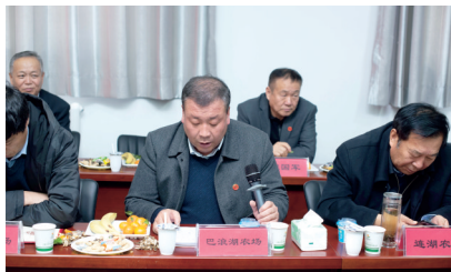
兄弟农场代表座谈发言