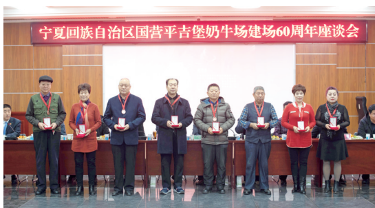
“建设者”纪念章获得者代表