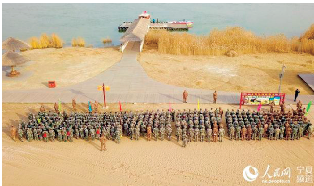
日前,宁夏沙湖景区开展年度军事拓展训练,磨砺员工意志品质、培养团队战斗力。近400名参训人员身着统一戎装,高呼口号,齐唱军歌,队伍犹如一条迷彩“长龙”在沙漠腹地穿行,绵延数公里。