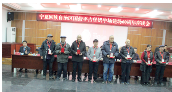
“拓荒者”纪念章获得者代表